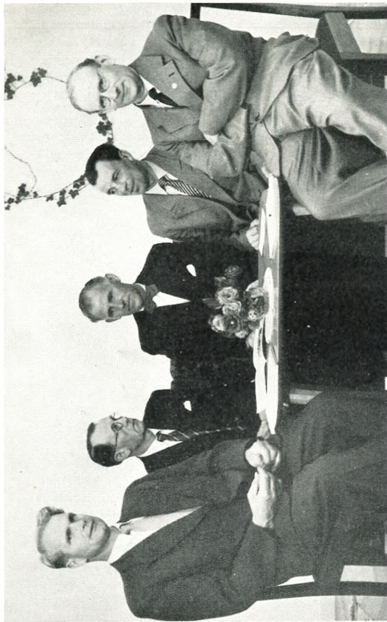
Föreningens nuvarande styrelse.